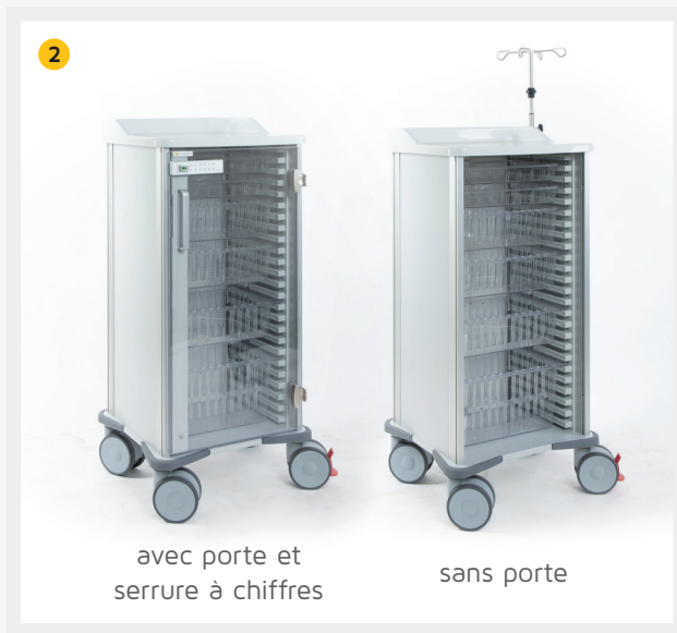
avec porte et serrure à chiffres